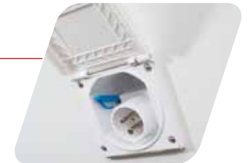
Toma exterior (P17) Presa esterna (17poli)