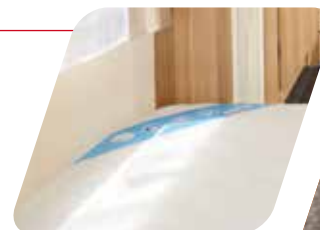
Colchón de alta densidad con somier de láminas Materasso alta densita rete a doghe