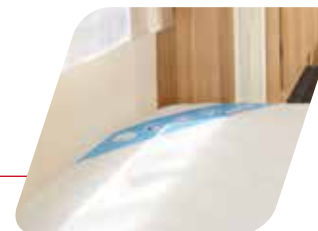
Colchón de alta densidad con somier de láminas Materasso alta densita rete a doghe