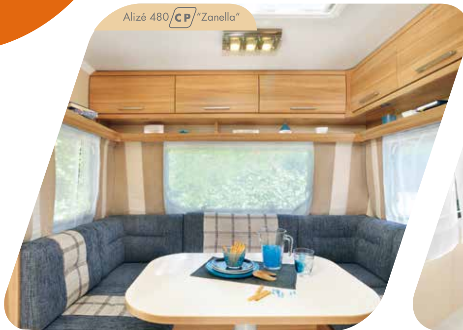
Alizé 480 CP "Zanella"