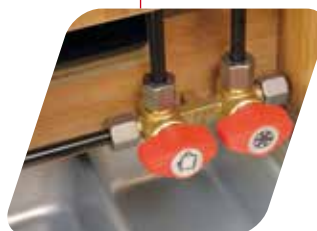
Distribución del gas Centralina gas