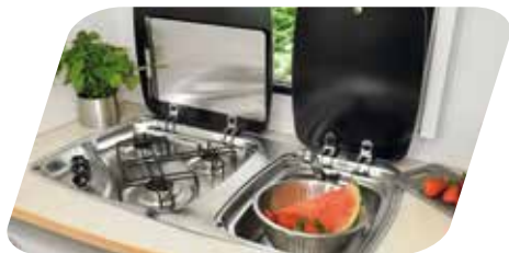
Cocina-fregadero inox 3 fuegos con tapa de vidrio Fornello 3 fuochi/lavello inox