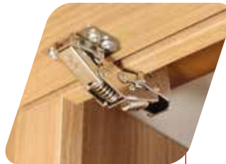
Bisagra reforzada de presión Cerniere