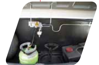
Cofre delantero para bombona gas Gavone porta bombole