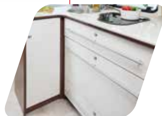
XL FREEZE XL FREEZE