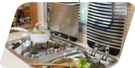
Cocina-fregadero inox 3 fuegos con tapa de vidrio Fornello 3 fuochi/lavello inox