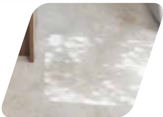
Revestimiento de suelo Pavimentazione