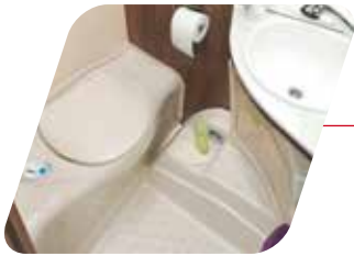
WC cassette Thetford eléctrico WC a cassetta Thetford elettrico