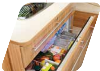
XL FREEZE XL FREEZE