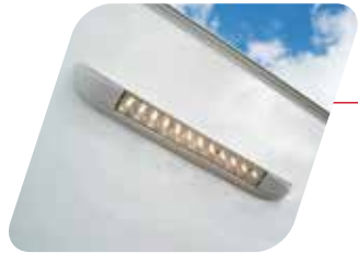
Luz exterior de avance Illuminazione veranda