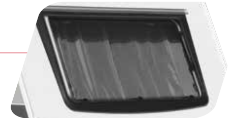
Todas las ventanas abatibles + ventana delantera panorámica con oscurecedor + mosquiteras Tutte le finestre sono apribili + finestrone anteriore panoramico combinato di oscurante e zanzariera