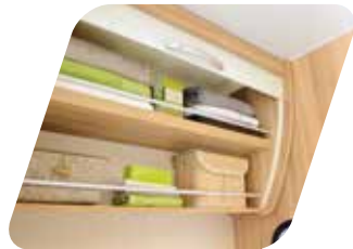
Cuarto de aseo Toilette