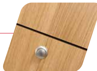
Film del mobiliario Nogal natural Film mobili color Noce Naturale