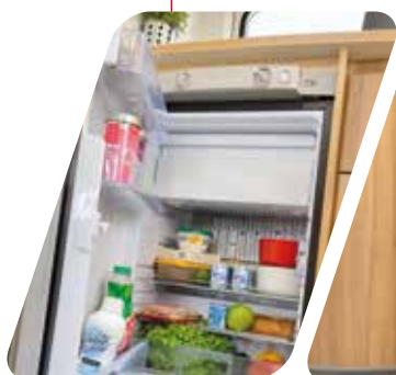
Frigorífico tri-mixto 90 L Frigorifero trivalente anti dislivello 90 L