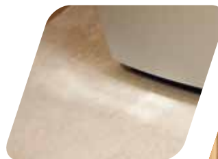
Revestimiento de suelo Pavimentazione