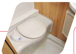
WC cassette Thetford eléctrico WC a cassetta Thetford elettrico