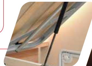
Apertura asistida del somier Apertura assistita della rete