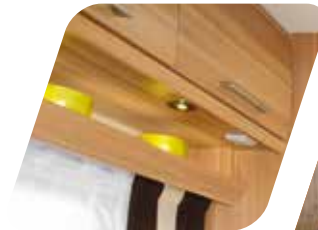
Spots orientables + regleta de LED Spot orientabili + bande a led