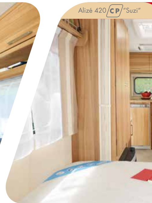
Alizé 420 CP "Suzi"