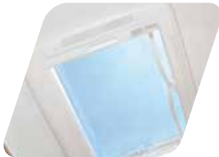
Claraboya 70x50cm Oblò panoramico