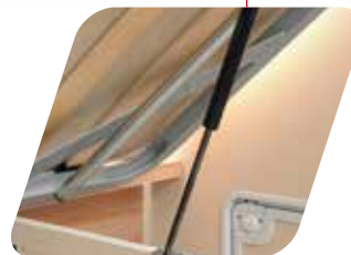
Apertura asistida del somier Apertura assistita della rete