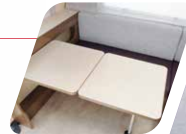
Mesa totalmente escamoteable Tavolo totalmente a scomparsa