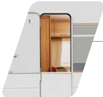
Puerta de doble hoja Porta doppia battente