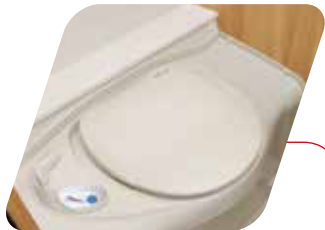
WC cassette Thetford eléctrico WC a cassetta Thetford elettrico