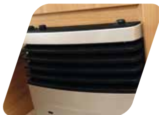
Calefacción de gas TRUMA Stufa TRUMA